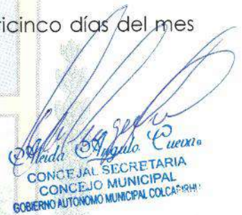
Concejal Secretaria CONCEJO MUNICIPAL GOBIERNO AUTÓNOMO MUNICIPAL COLCAPIRHUA

LEY MUNICIPAL DE DECLATORIA DE NECESIDAD Y UTILIDAD PUBLICA DE EXPROPIACION DE BIEN INMUEBLE PARA LA CONSTRUCCION DEL EQUIPAMIENTO UNIDAD EDUCATIVA SAN CRISPIN DISTRITO "E", UBICADO EN LA OTB "SINDICATO AGRARIO ESQUILAN GRANDE, CON UNA SUPERFICIE DE 1,200 M2.