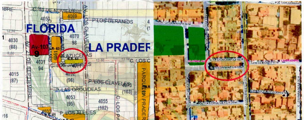
PLANO SEGÚN IMAGEN RASTER