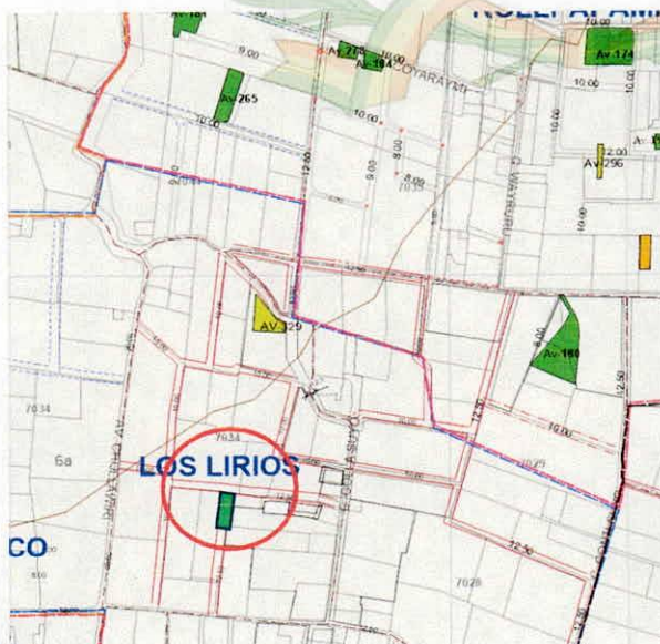
PLANO SEGÚN IMAGEN RASTER