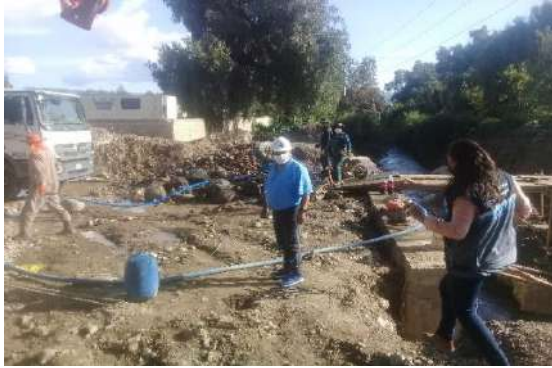
INSPECCIÓN PROYECTO: CONSTRUCCIÓN PUENTE CHIJLLAWIRI.