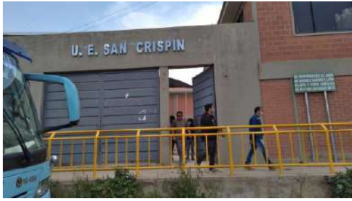
U.E. SAN CRISPIN