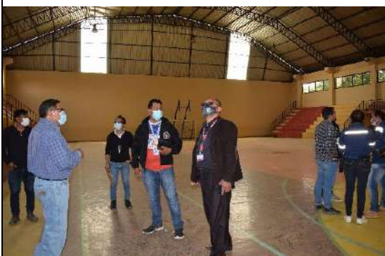
U. E. FERROVIARIO MAX FERNANDEZ