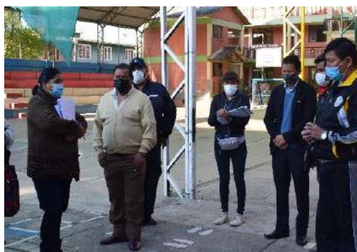
U.E. SAN LORENZO