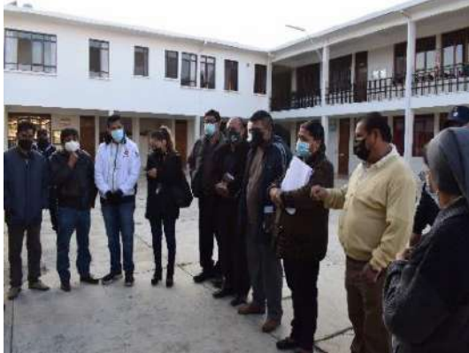
CENTRO EDUCATIVO MARÍA AUXILIADORA