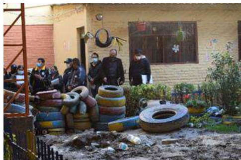
U.E. SAN JOSÉ DE KAMI