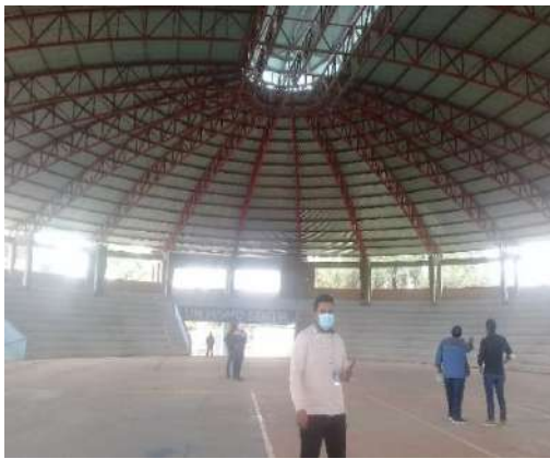
INSPECCIÓN ESTADIO SAMANCHA URABI.