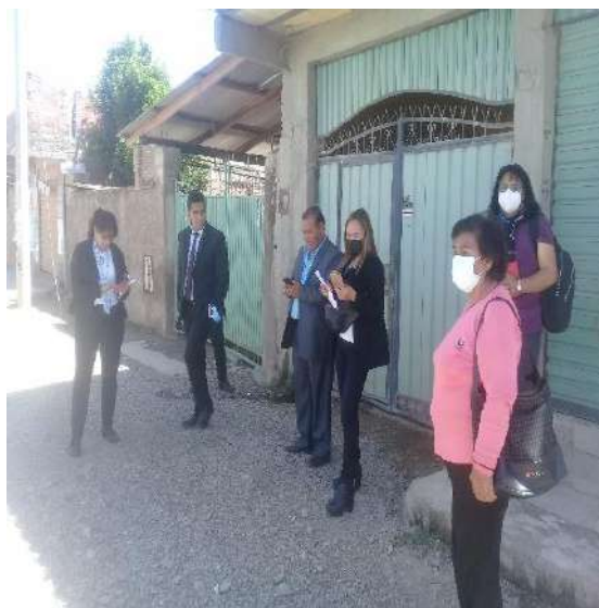
INSPECCIÓN AMBIENTES PARA LA DEFENSORÍA DE LA MUJER.